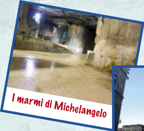
I marmi di Michelangelo