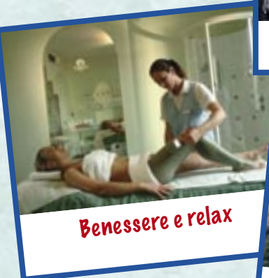
Benessere e relax