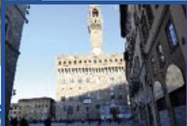
Firenze e Palazzo Vecchio